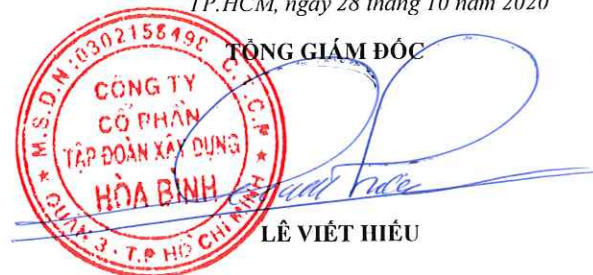
LÊ VIỆT HIẾU

Báo cáo tài chính hợp nhất này phải được đọc chung với các thuyết minh kèm theo